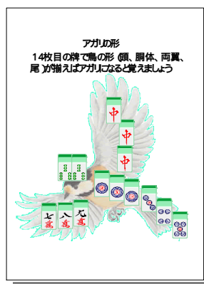
今回専用の講座カリキュラム